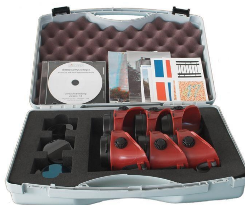
3 experimentální brýle s nastavci v ukládacím kufru (113.3104)