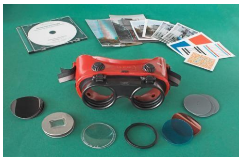
Experimentální brýle s nastavci