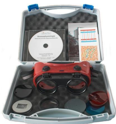
Experimentální brýle s nastavci v ukládacím kufru (113.3103)